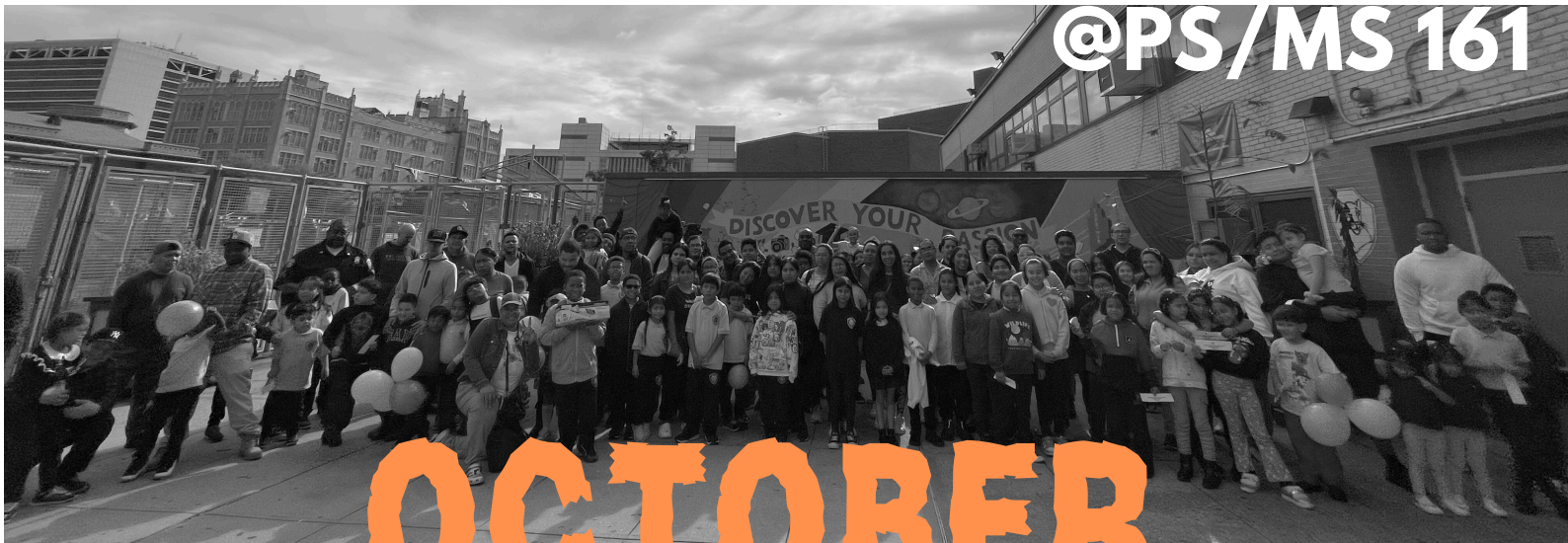
09/30 - Walk your child to school day